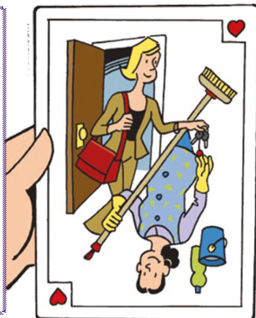
Ressources mensuelles pour le plan d'aide personnalisé

Les ayants-cause (veuf et veuve non remarié.e.s) des bénéficiaires mentionné.e.s ci-dessus, titulaires d'une pension de réversion, sous réserve de ne pas être éligibles à une prestation de même nature sont concerné.e.s par ce dispositif.